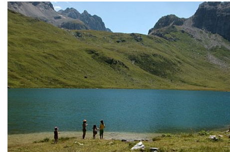
Office de Tourisme de Peisey-Vallandry

Très joli lac de montagne dans un environnement préservé. Le lac se situe sur le GR5, et en bordure du Parc national de la Vanoise. Il est accessible à pied, compter 2h30 depuis le refuge de Rosuel, et l'on peut aisément observer des marmottes aux abords du lac. Les pêcheurs peuvent s'y adonner à leur sport favori les mardis, jeudis, dimanches et jours fériés du 2 juin au 29 septembre 2019.