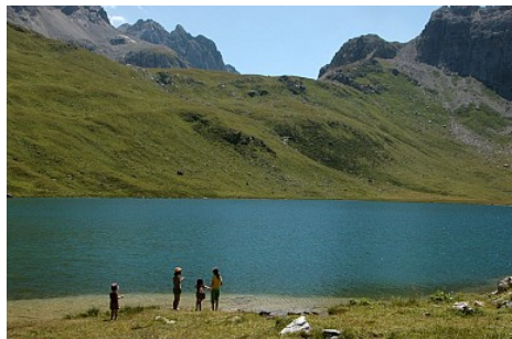
Office de Tourisme de Peisey-Vallandry

Très joli lac de montagne dans un environnement préservé. Le lac se situe sur le GR5, et en bordure du Parc national de la Vanoise. Il est accessible à pied, compter 2h30 depuis le refuge de Rosuel, et l'on peut aisément observer des marmottes aux abords du lac. Les pêcheurs peuvent s'y adonner à leur sport favori les mardis, jeudis, dimanches et jours fériés du 2 juin au 29 septembre 2019.