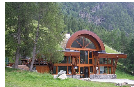
office de tourisme de Peisey-Vallandry

Dispositions spéciales COVID 19 : Propose des plats transportables : les plats sont transportables (avec couverts biodégradables). On peut manger en terrasse ou sur l'herbe un peu plus loin. A l'intérieur en cas de mauvais temps.